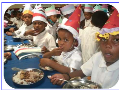
Un repas très attendu