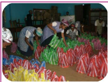
Préparation des cadeaux

Pour cette fin d'année VTM a offert des uniformes, tabliers et cahiers aux élèves les plus pauvres.