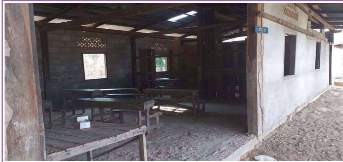
La toiture du bâtiment actuel est vraiment endommagé

Ban Houakhor est un village situé dans la province orientale de Savannakhet au Laos à 140 kilomètres de la municipalité, district de Songkhone. Il est composé d'environ 150 maisons pour 985 habitants dont 35% savent lire et écrire. Ce village possède une école primaire de cinq classes, du CP au CM2.