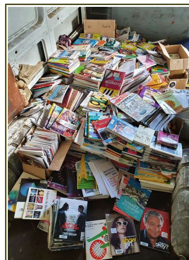
Lycée Jean Macé

Tout les deux mois depuis plus d'un an, je récupère chez cette famille Cantepienne un coffre de voiture de papiers, journaux et magazines. En fin d'année scolaire, cette personne étant Professeur au Collège du Landry m'a proposé les anciens manuels scolaires.