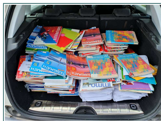
Collège du Landry

Tout les deux mois depuis plus d'un an, je récupère chez cette famille Cantepienne un coffre de voiture de papiers, journaux et magazines. En fin d'année scolaire, cette personne étant Professeur au Collège du Landry m'a proposé les anciens manuels scolaires.