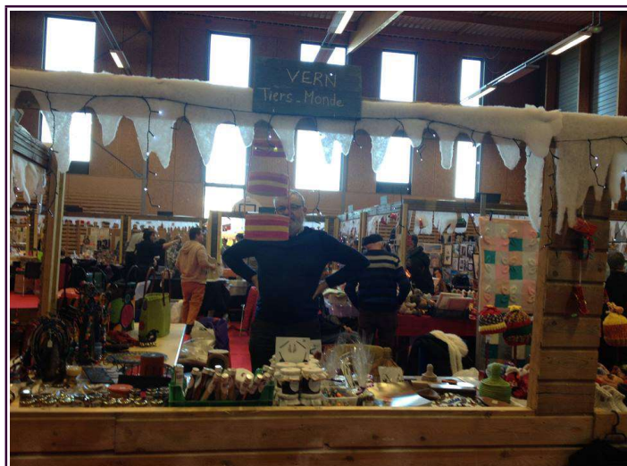
Marché de Coesmes sur deux jours

Les marchés de Noël ont eu dans l'ensemble une très belle fréquentation. Une sortie familiale qui avait manqué l'an dernier pour certains, des retrouvailles pour d'autres personnes habituées de venir nous rencontrer pour discuter des projets en cours de l'association, des différentes actions, SoliRando, parrainages. Merci aux personnes qui ont donné de leur temps pour tenir les divers stands de Noël.