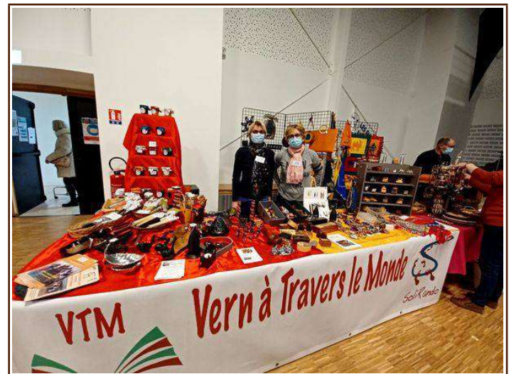
Marché de Betton