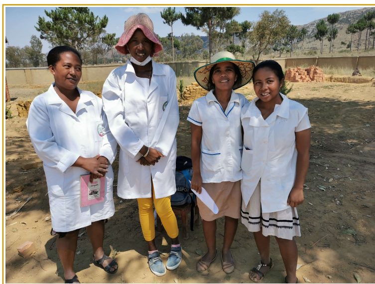
Les maîtresses d'Imanja

Les conditions sanitaires actuelles font que l'état a durci les conditions d'entrée avec en plus un confinement à l'arrivée. Il est trop compliqué d'y faire venir un groupe cette année mais nous gardons espoir pour 2023.