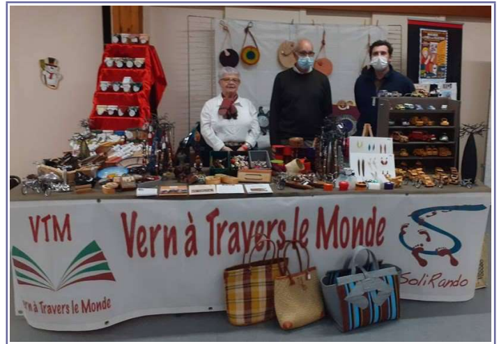
Marché de Vern sur Seiche