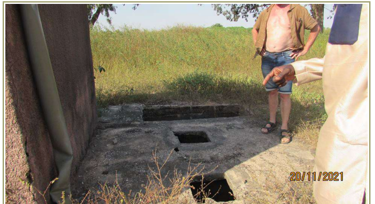
La fosse septique