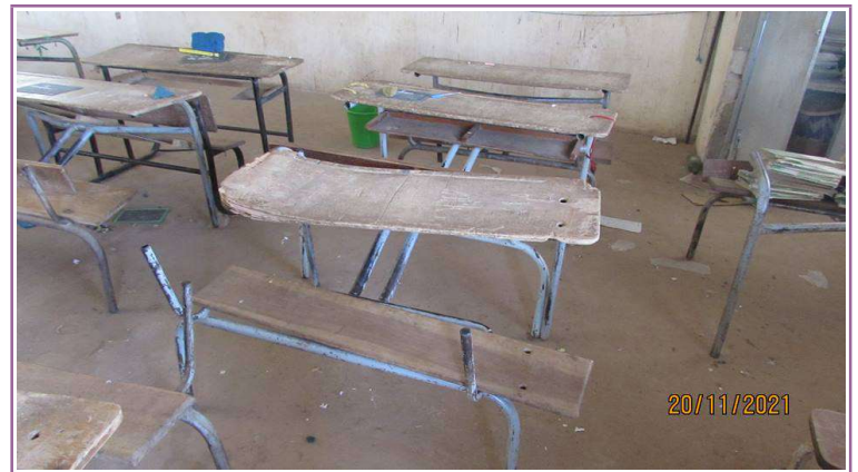
Du mobilier très abîmé

avec qui nous sommes en contact depuis plusieurs années déjà.