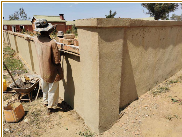
Finition du mur de l'école

Les contacts ont été repris avec la présidente de l'association des « écoles rurales malgaches » mais il faut attendre une reprise des cours. Sur Imanja les rencontres étaient relancées avec une forte motivation et des progrès énormes. Les enfants du village saluent désormais en français le vazaha qui croise leur chemin. Tout le monde attend donc que l'école recommence et peut-être verra-t-on trois ou quatre français venir y participer cette année.