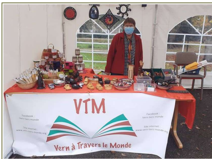
Marché à l'Ehpad du Clos d'Orrière de Vern