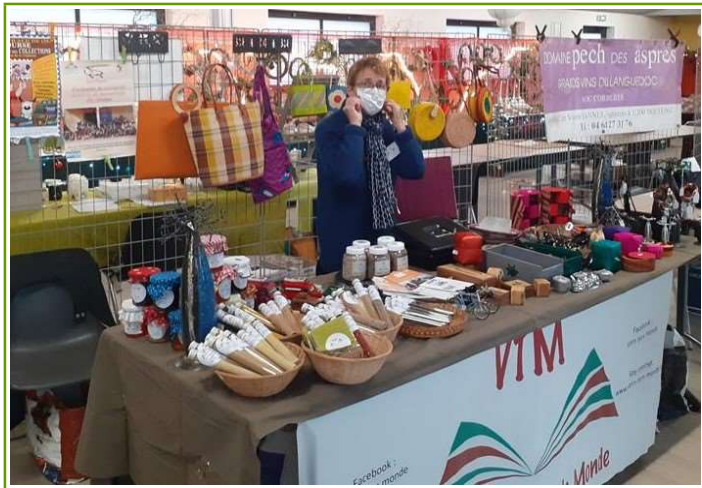
Marché de Lassy