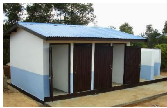
Bloc sanitaire aujourd'hui.

L'équipe de Vern Tiers Monde continue ses rencontres et ses vérifications des travaux pris en charge par l'association. Elle vérifie notamment la bonne mise en place d'une opération d'apiculture, génératrice de revenus pour les parents d'élèves, en contrôlant l'état des ruchers installés sur la commune d'Ambolo et continue la troisième partie de la formation aux apiculteurs malgaches.