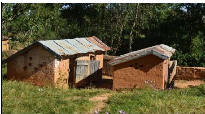
« Toilettes » d'hier.

« Il restait la construction d'un bloc sanitaire digne de ce nom et en conformité avec les normes du pays. C'est chose faite depuis cette année, avec la participation du Syndicat des eaux du bassin rennais, de Vern Tiers Monde et de la population locale. »