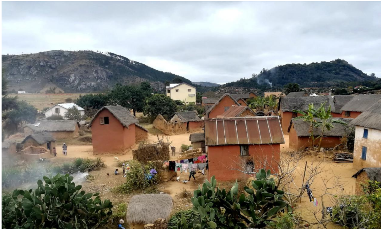
Village d'Imanja près d'Ambohimanga