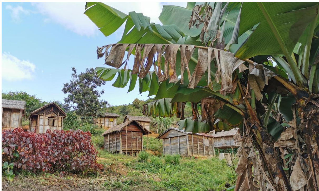
Village de Mahatsara près d'Andasibe

Notre hôtel se situe en pleine nature à 500 mètres du bourg. Ce dernier est donc accessible facilement ainsi que les petites boutiques locales de la rue principale. Quatre écoles seront visitées et là encore, une d'entre elles, un peu plus soutenue.