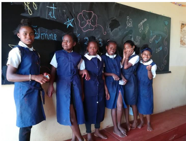
Les 6 è

Donc, en tout, plus de 450 bouches à nourrir 5 jours sur 7. Le jardin potager est cultivé en maïs, manioc, légumes pour essayer de subvenir au besoin de la cantine. Mais, à 99%, le collège ne fonctionne pas sans les bienfaiteurs. En effet, le frais de scolarité dérisoire demandé aux parents d'élèves ne suffira jamais au fonctionnement du collège.