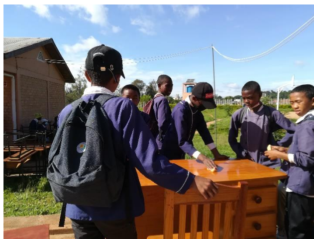
Les garçons de 5 e

En tout cas, pour cette nouvelle année scolaire, la 7 e est à 42 effectifs, la 3 e , 24. En 7 e , la maitresse se plaint de 5 élèves qui ne sont pas du tout à la hauteur. Elle craint qu'il faille les mettre sous condition c'est-à-dire, convoquer leurs parents et leur faire signer des lettres d'engagement afin qu'ils suivent leurs enfants à la maison ; les aidant à apprendre les leçons. Ce n'est guère facile pour les parents car ils ont à travailler dur. Certains ne sont point à la maison dès 3h du matin et n'y reviennent que vers 19h. Les classes d'examen sont plus disponibles à étudier un peu plus à la maison. Ce n'est pas le cas pour les élèves des classes intermédiaires. Dès qu'ils sont à la maison, ils sont voués à eux-mêmes, ils s'adonnent aux travaux ménagers, aident, remplaçant