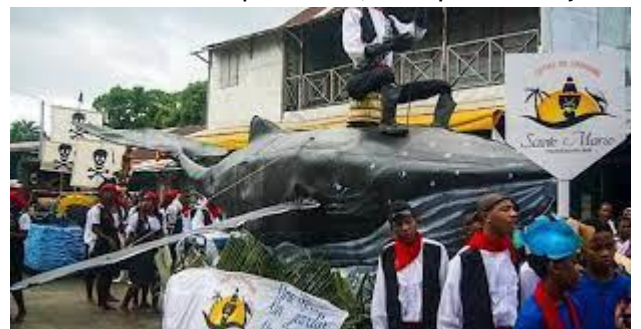
Festival des baleines

Le passage des baleines à bosse pendant l'hiver austral du côté de cette île est un grand évènement touristique. Chaque année, « le festival des baleines » est organisé. Toute l'île est en fête. Pour cette année, le président Rajoelina, accompagné d'une forte délégation gouvernementale, est au rendez-vous. Julien Lepers, ancien présentateur de l'émission question pour un champion est parrain du festival. Chaque année, il est présent. Il y est très connu. Sainte Marie est également un ancien repaire de pirates. Elle est la porte d'entrée du catholicisme au pays. L'église Notre Dame de l'Assomption est la première église catholique construite à Madagascar. Elle a été rénovée et fait partie du circuit « Pirate Island » inauguré le samedi 15 Juillet à Sainte Marie. L'aéroport de l'île : l'aéroport Ravoraha est certifié aéroport international le 14 Juillet dernier. Ce certificat est obtenu après différentes améliorations 80 ans après le premier vol qui a atterri à Sainte Marie.