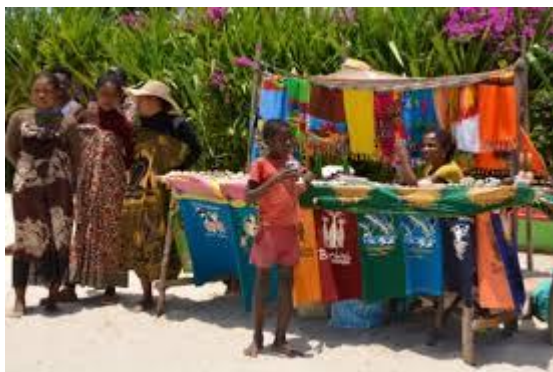
Voandalana de Nosy Be

à partir du 1 er Juillet dernier. Bien sûr, tous les emplois liés au tourisme sont au paroxysme de développement comme les guides touristiques, les agences de voyage, l'hôtellerie jusqu'à l'Art malagasy inévitable « Voandalana » (articles de souvenir). Entre Novembre et Mars, près de 20 bateaux de croisière sont prévus accoster sur Nosy Be, entre autre : costa et Aida transportant chacun à leurs bords plus de 1000 touristes. L'île au fleur est réputé par le tourisme balnéaire avec le sport nautique, les balades en mer en passant par la découverte culinaire. D'ailleurs, du 2 au 13 Aout 2023, le festival Sômaroho aura lieu à Nosy Be qui fêtera ses 10 ans, encore une occasion de mettre en valeur l'île.