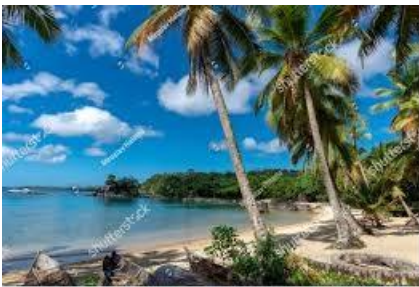
Ile Sainte Marie

Le tourisme balnéaire n'est point en reste : Sainte Marie et Nosy Be sont des lieux inévitables pour « la destination Madagascar ». La pandémie a mis à terre le tourisme malagasy. Ces deux îles touristiques : Sainte Marie et Nosy Be étaient dans une crise totale. Actuellement, elles essayent de sortir de l'ombre autant que possible. Sainte Marie ou Nosy Boraha est une île à vocation touristique avec la plage de sable blanc, de la mer et de la saison des baleines.