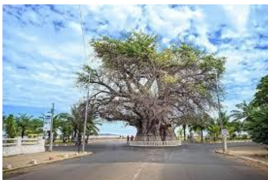
Le fameux baobab de Mahajanga

Donc, le tourisme extérieur refait surface tandis que le tourisme intérieur s'avance à petit pas. Certes, peu de Malagasy, peut s'offrir cette opportunité mais, il se développe. La visite du Rovany Madagasikara intéresse du monde. Les parents sont nombreux à y amener leurs enfants. En tout cas, pour les tananariviens, la visite du parc zoobotanique de Tsimbazaza est incontournable et même pour tout Malagasy venant à Antananarivo. En ces temps de vacances, selon les moyens du bord, chaque famille fait de son mieux, du moins, ceux qui peuvent se le permettre. Les parents s'arrangent pour que leurs enfants changent d'air : séjourner chez les grands-parents à la campagne, « monter » en ville chez des