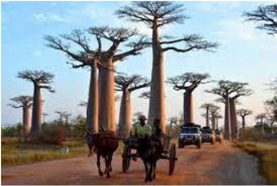
L'allée de baobabs

Notre pays a une grande potentialité touristique. Les atouts dans ce domaine sont évidents tels que la nature comme dame soleil, les plages, la faune et la flore endémiques des aires protégées. Aussi, Madagascar présente différents sites touristiques. Citons les sites historiques et culturels comme le rovan'i Madagasikara (rova signifie palais) récemment rénové, le palais d'Ambohimanga, certains rituels comme le Sambatra (circoncision commune