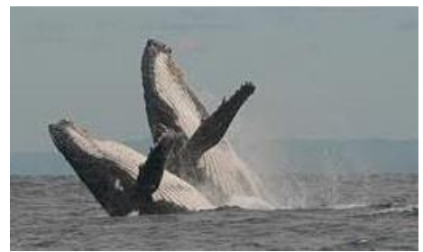
Baleines à bosse

Le passage des baleines à bosse pendant l'hiver austral du côté de cette île est un grand évènement touristique. Chaque année, « le festival des baleines » est organisé. Toute l'île est en fête. Pour cette année, le président Rajoelina, accompagné d'une forte délégation gouvernementale, est au rendez-vous. Julien Lepers, ancien présentateur de l'émission question pour un champion est parrain du festival. Chaque année, il est présent. Il y est très connu. Sainte Marie est également un ancien repaire de pirates. Elle est la porte d'entrée du catholicisme au pays. L'église Notre Dame de l'Assomption est la première église catholique construite à Madagascar. Elle a été rénovée et fait partie du circuit « Pirate Island » inauguré le samedi 15 Juillet à Sainte Marie. L'aéroport de l'île : l'aéroport Ravoraha est certifié aéroport international le 14 Juillet dernier. Ce certificat est obtenu après différentes améliorations 80 ans après le premier vol qui a atterri à Sainte Marie.